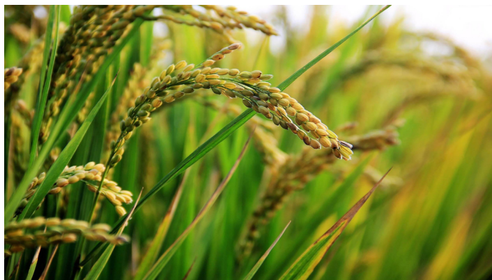
Рис начали убирать в Приморье

150 гектаров риса убрали сельхозпроизводители Хорольского муниципального округа Приморья. По словам специалистов, данная культура не сильно пострадала в результате чрезвычайной ситуации в крае.